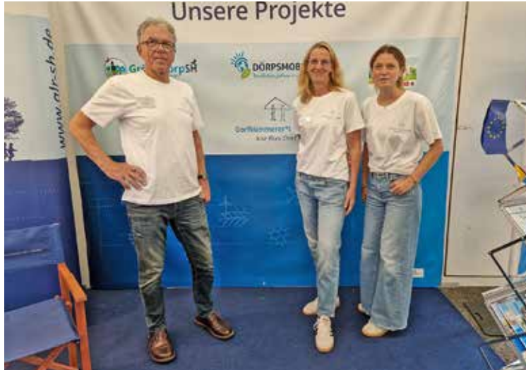
Die Dorfkümmerer und die Akademie für ländliche Räume präsentierten sich im vergangenen Jahr mit einem Stand auf der Norla.

Die Akademie für die ländlichen Räume hat dieses Netzwerk von Anfang an begleitet und eine Koordinierungsstelle für die Dorfkümmerer eingerichtet. Wann war das und was war der Anlass?